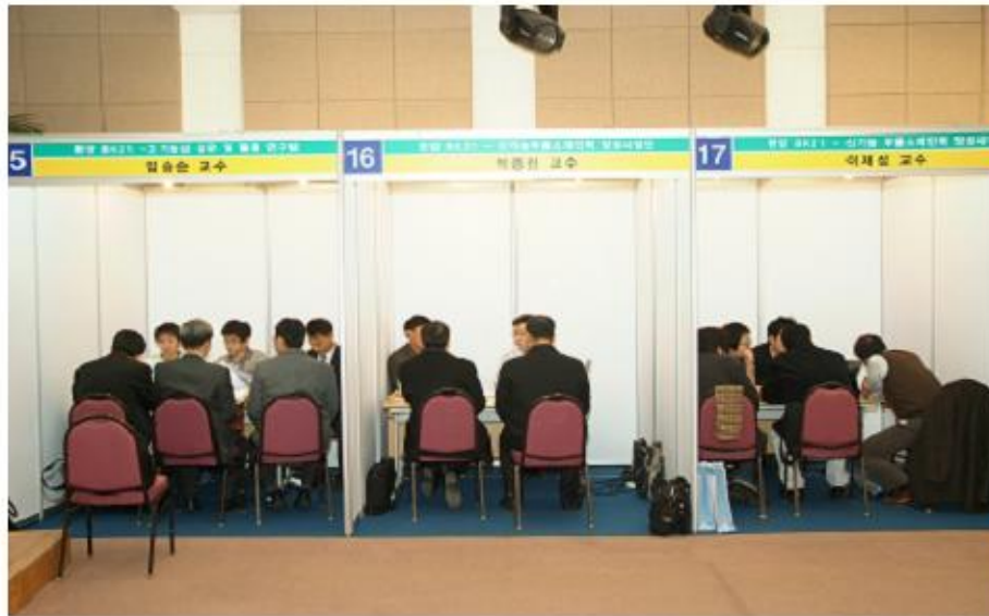
- 기술상담 -