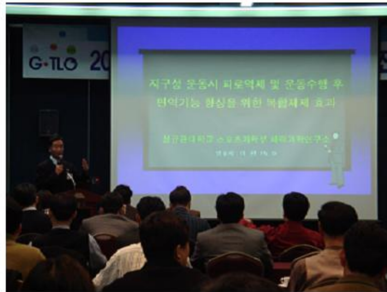
- 기 술 설 명 -