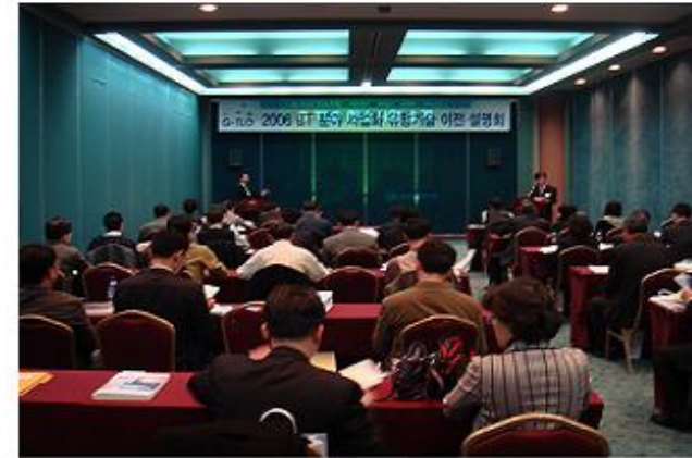
- 개 회 식 -