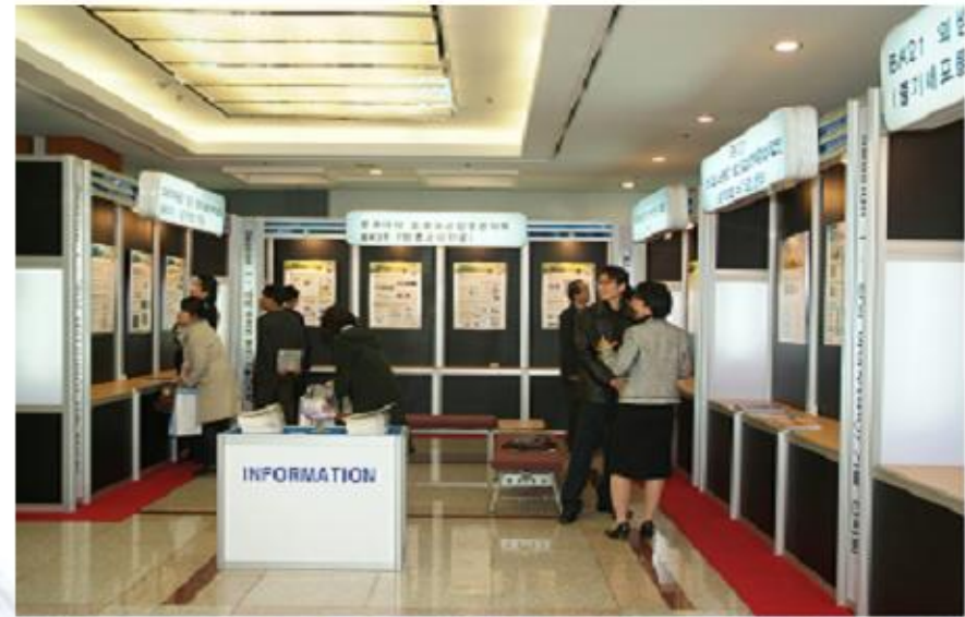
- 기술전시 -