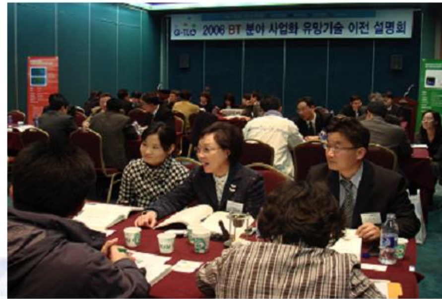
- 기 술 상 담 -