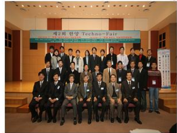
- 개회식 -